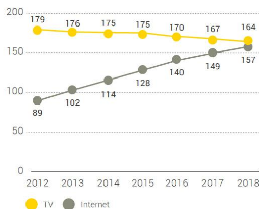
Evolución del consumo diario medio de TV vs Internet. En minutos